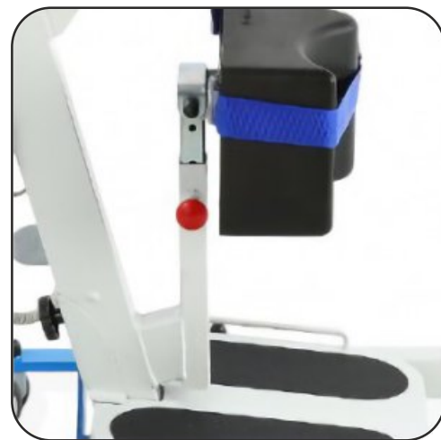
Regulación en altura y basculante.