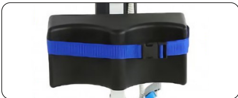
Fijación de las piernas con cintas.