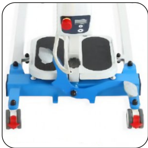
Pedal de apertura y para de emergencia.