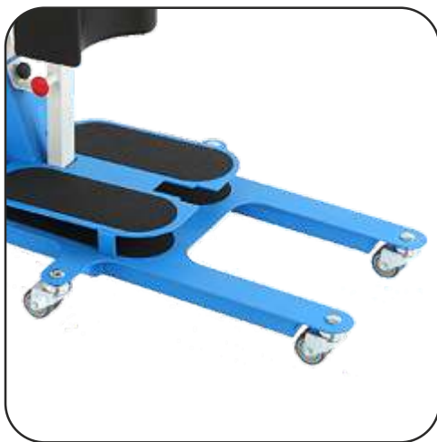
2 ruedas dobles y 2 ruedas dobles centrales.