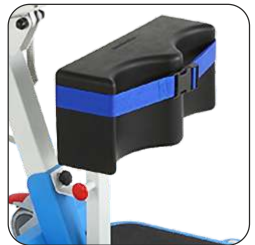
Regulación en altura y basculante y fijación de las piernas con cintas.