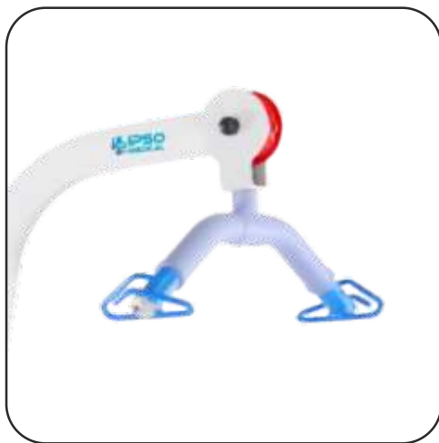
Percha con caucho termoinyectado.